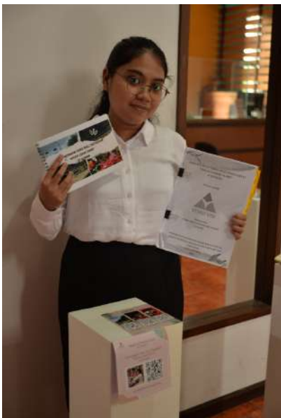
Gambar 5.6 Foto Sidang