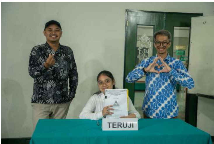
Gambar 5.5 Foto Sidang