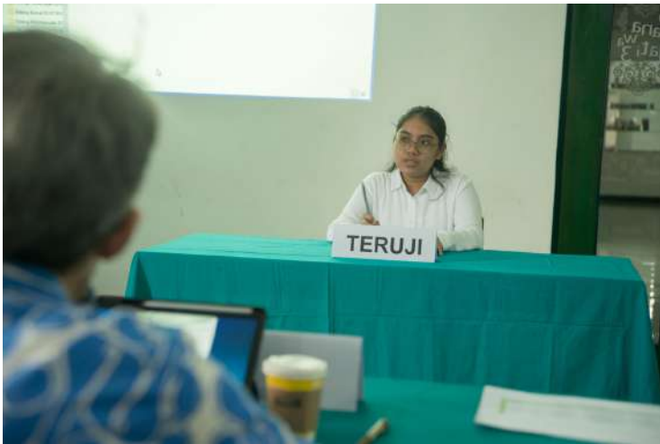
Gambar 5.4 Foto Sidang