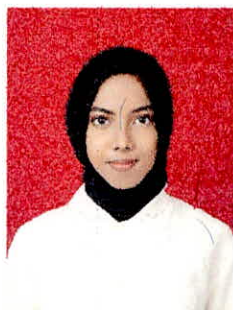
Tina Khansa Nabila Tanda tangan pemilik Signature of holder