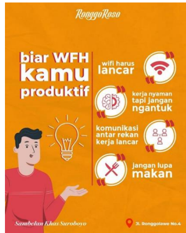
Gambar 2. 6 Desain Feed Instagram Ronggolatte 2