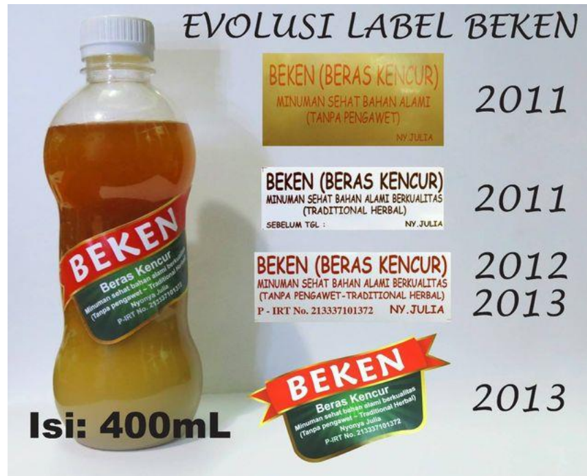
Gambar 2. 2 Evolusi Logo BEKEN