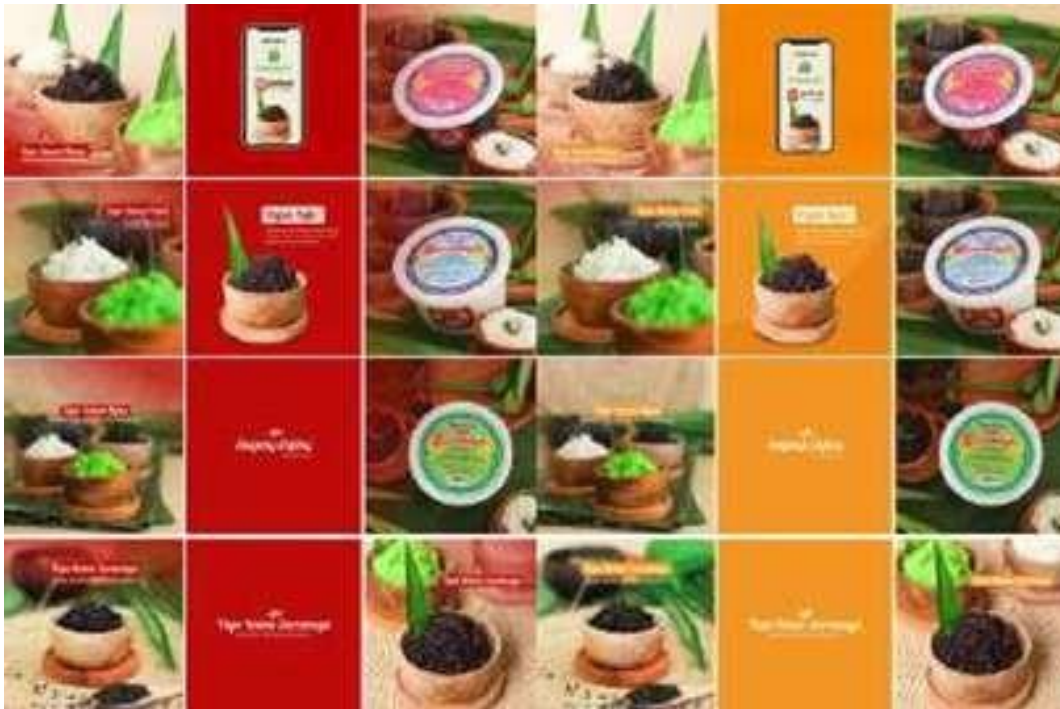
Gambar 2. 10 Desain Feed Instagram Tape Ketan Surabaya

(Sumber: “Perancangan Feed Instagram Sebagai Media Promosi Tape Ketan Surabaya”, Surabaya: Universitas Negeri Surabaya)