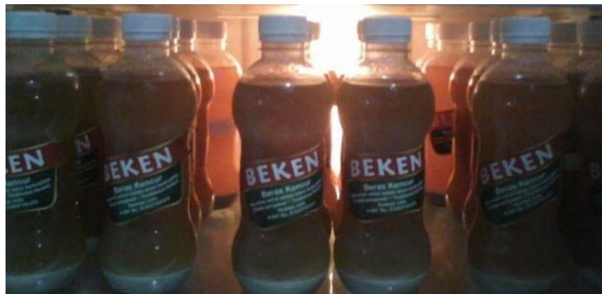
Gambar 2. 3 Foto Produk