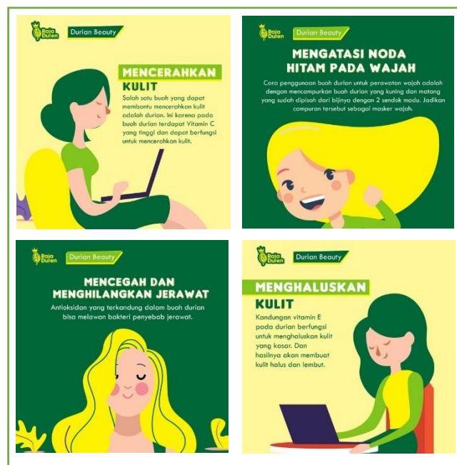
Gambar 2. 11 Desain Feed Instagram Raja Duren

(Sumber: “Perancangan Konten Media Promosi Raja Duren Pada Sosial Media Sebagai Upaya Meningkatkan Brand Recall ”, Surabaya: Universitas Dinamika)