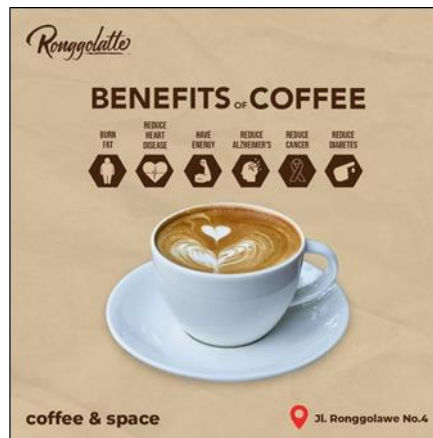
Gambar 2. 5 Desain Feed Instagram Ronggolatte 1