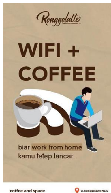
Gambar 2. 7 Desain Feed Instagram Ronggolatte 3