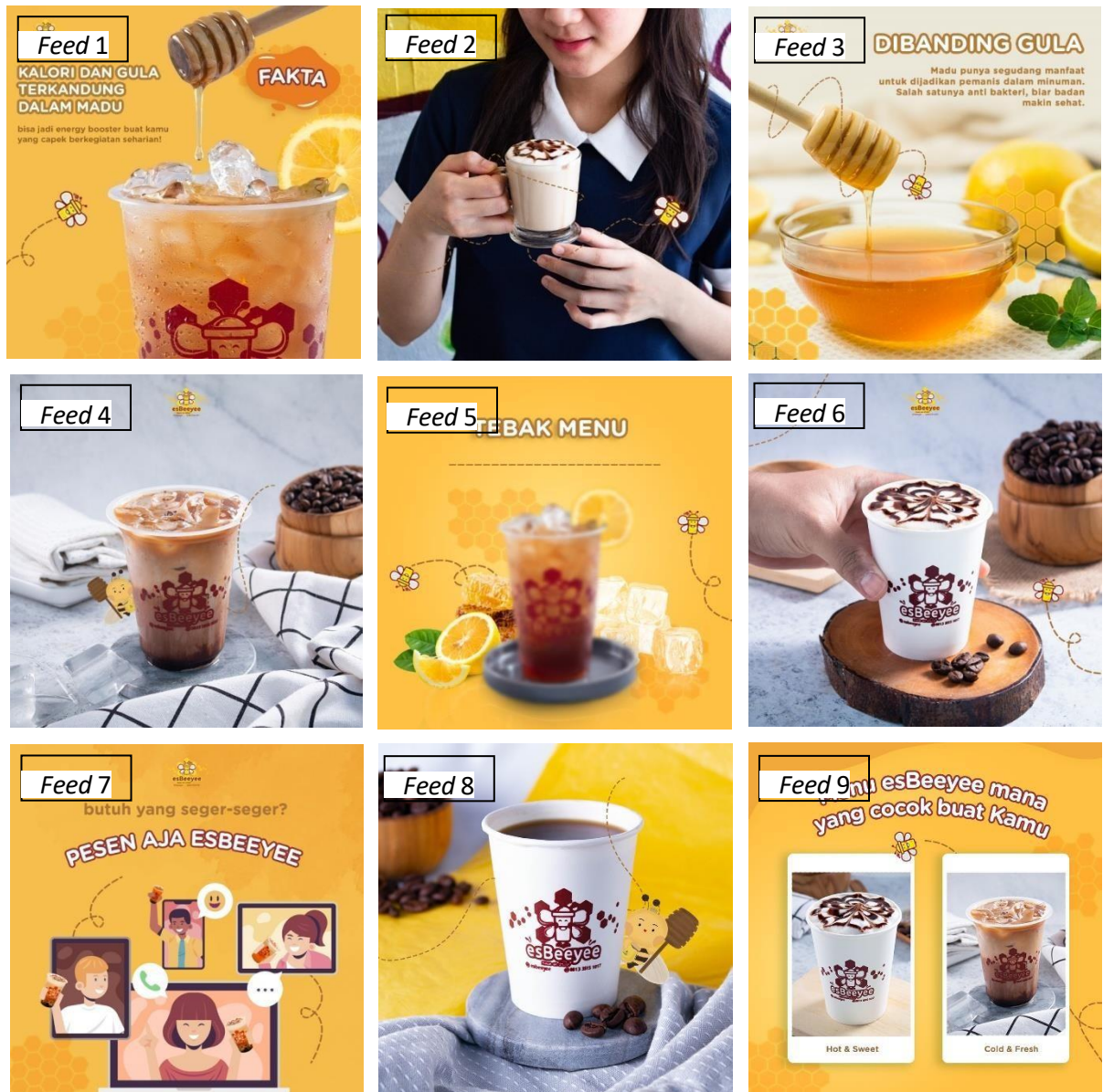
Gambar 2. 8 Desain Feed Instagram Esbeeyee

(Sumber: “Perancangan Desain Konten Media Sosial Instagram Esbeeyee Sebagai Media Promosi”, Surabaya: Universitas Dinamika)