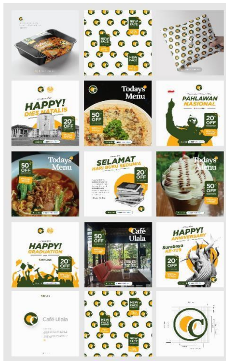
Gambar 2. 9 Desain Feed Instagram Cafe Ulala