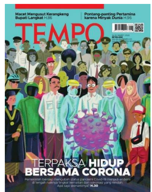
Gambar2. Cover Majalah Tempo