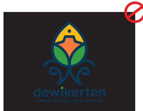
Jangan posisikan logo pada background/ latar belakang dengan warna hitam/gelap.