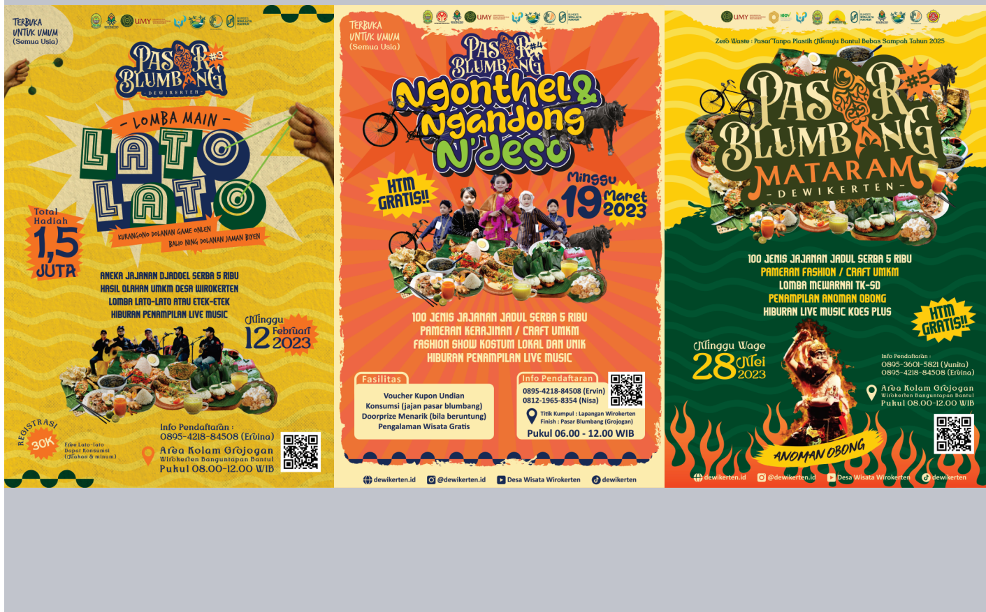
Poster Pasar Blumbang