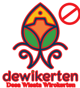
Jangan memberi outline pada logo.