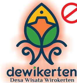
Jangan memberi efek, mengubah font, memberi elemen tambahan.