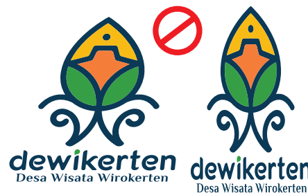
Jangan menarik/me-rizise logo sembarangan.