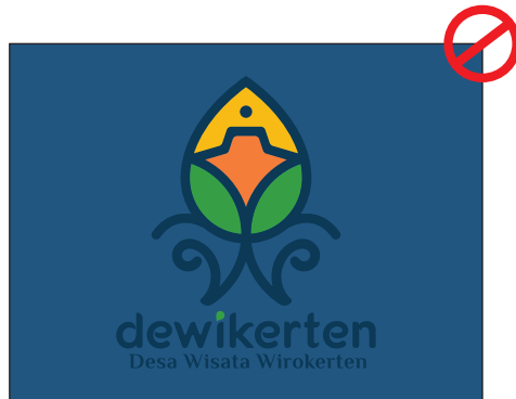
Jangan posisikan logo pada background/ latar belakang dengan warna yang sama.

Tidak diperkenankan mengubah, memanipulasi maupun menghias, dan memberi efek pada logo.