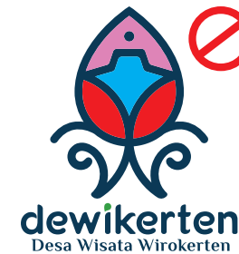
Jangan mengubah warna diluar palette, mengubah komposisi logo, dan mengisi dengan pattern.