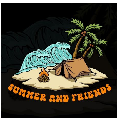
Gambar 3 Ilustarsi Summer And Friends

Desain ilustrasi yang di buat untuk dijual sebagai merchandise pecinta sabung ayam dari salah satu komunitas sabung ayam yang berada di Imogiri, Bantul, Yogyakarta. Desain yang menggambarkan dua ayam jantan yang sedang bertarung.