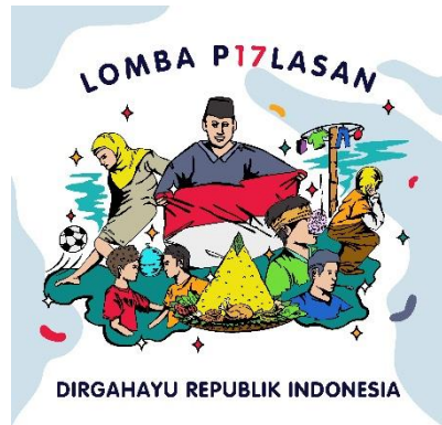
Gambar 4 Ilustrasi Lomba 17 Agustus

Sebuah desain ilustrasi yang dibuat untuk kebutuhan acara pada lomba 17 Agustus 2022 di desa penulis. Desain yang menggambarkan sebuah suasana lomba 17 Agustus seperti lomba makan kerupuk serta lomba balap karung.