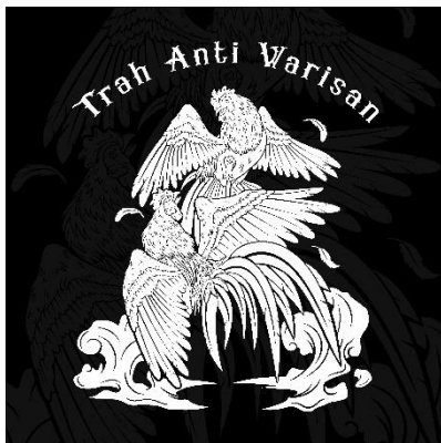
Gambar 2 Ilustrasi Trah Anti Warisan

Desain ilustrasi yang berkolaborasi dengan kampus STSRD VISI yang memiliki tema “Kuliah Asik Sambil Piknik”. Desain ilustrasi yang merepresentasikan kegiatan-kegiatan kampus seperti survei tempat untuk keperluan mencari data. Perpaduan warna dan suasana menngambarkan lokasi dalam mencari data.