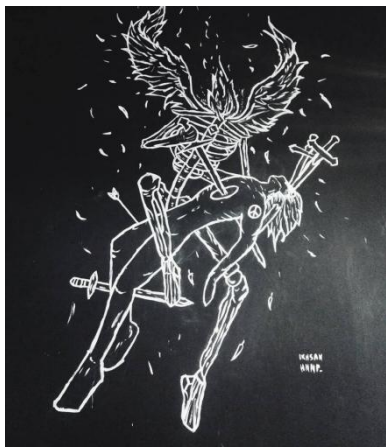
Gambar 1.2 Komisi mural di tembok dengan ukuran 2.5m x 4m