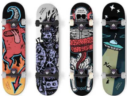
Gambar 1 Komisi Project Papan Skateboard Cruz diablo

Skill Unggulan yang dimiliki oleh penulis untuk memenuhi minat utama meliputi kemampuan ilustrasi tradisional dan software digital yang berupa adobe illustrator , adobe photoshop , dan blender .