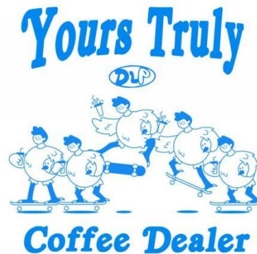
Gambar 1.1 Ilustrasi untuk Bendera Cafe Daily Life Pleasure