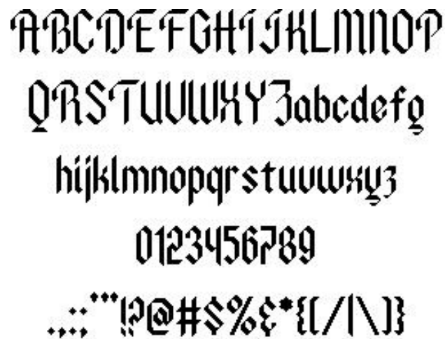
Gambar 3.7 Font Ancient Modern Tales

Font Ancient modern tales digunakan untuk bagian "Gugur" dalam font "Abimanyu Gugur.