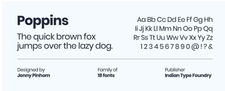
Gambar 3.6 Font Poppins (sumber:google font)

Pada perancangan ini menggunakan 2 font, yaitu Poppins dan Ancient modern tales. Font Poppins digunakan untuk bagian keterangan.