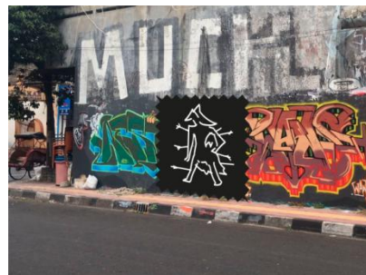
Gambar 3.1 Layout desain mural di lokasi tembok