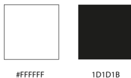
Gambar 3.4 Warna background

Warna adalah salah satu dalam unsur yang menghasilkan daya tarik visual. Warna hitam digunakan untuk background mural dan slayer, garis ilustrasi abimanyu untuk kaos dan tipografi di kaos. Warna hitam digunakan untuk background kaos dan frame tribal dan ilustrasi abianyu di slayer maupun mural.