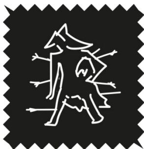
Gambar 3 Layout desain mural

Layout Mural dengan background warna hitam dengan setiap sisi berbentuk zig-zag agar lebih timbul diantara karya mural lainnya di publik. Garis putih untuk ilustrasi Abimanyu.