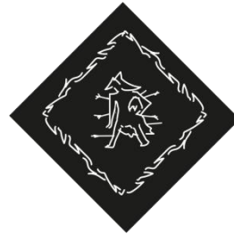
Gambar 3.3 Layout desain bandana