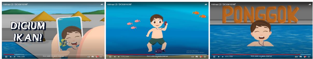
Gambar 1.2 Video Animasi 2D “Dicium Ikan!”