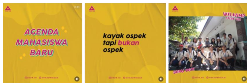
Gambar 1.4 Desain Feed Instagram Ospek dengan Animasi

Desain feed instagram yang berisi informasi ospek kampus STSRD VISI. Desain ini dibuat dengan teknik motion pada teks.