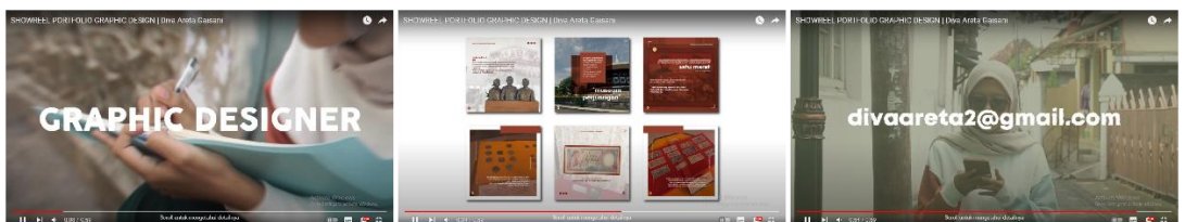
Gambar 1.3 Video Showreel Portfolio Graphic Design

Video ini dibuat untuk memenuhi tugas mata kuliah Portofolio pada semester 5. Konsep pada video ini perpaduan antara motion dan videography.