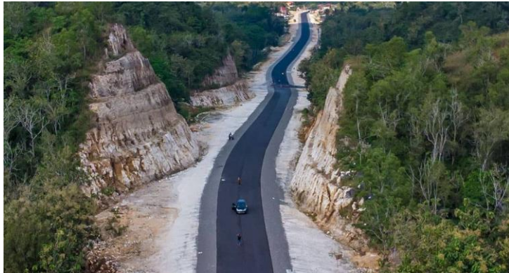
Gambar 2.8 Jalan Jalur Lintas Selatan Gunungkidul

Jalan baru yang dibuat oleh pemerintah Gunungkidul membentang diantara para bukit karang putih ini menjadi salah satu daya tarik baru wisatawan Gunungkidul.