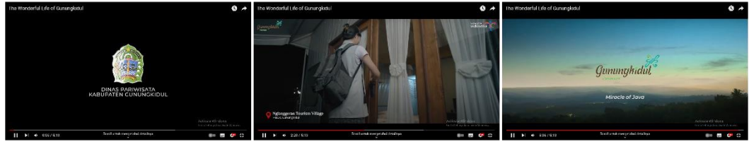
Gambar 2.10 Screenshot frame Video the Wonderful Life of Gunungkidul

Video profile ini berisi tentang berbagai macam wisata dan kegiatan yang ada di gunungkidul. Mulai dari wisata alam, wisata kuliner, tradisi dan lain-lain.