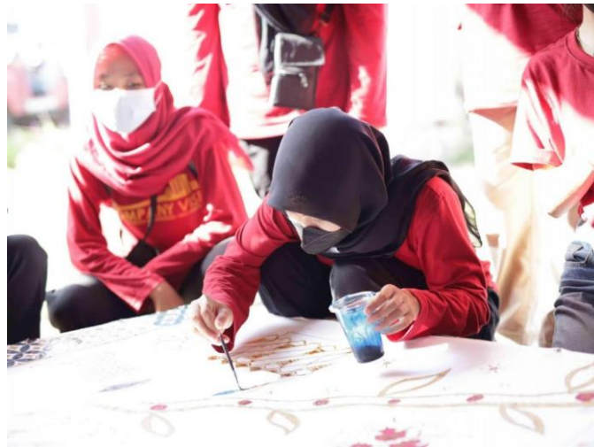
Gambar 2.7 Dewi Kampus Membuat Batik

Desa Wisata Tepus terletak di Kecamatan Tepus Gunungkidul. Ada banyak daya tarik pada Desa Wisata Tepus yang dikelola oleh komunitas Dewi Kampus mulai dari membuat batik, kerajinan perak, karawitan hingga pantai tersembunyi. Menarik lagi Desa Wisata Tepus menawarkan wisatawan untuk mengelilingi Tepus dengan menggunakan mobil Jeep.