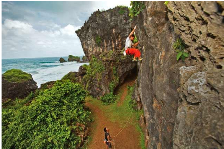
Gambar 2.2 Tebing Pantai Siung