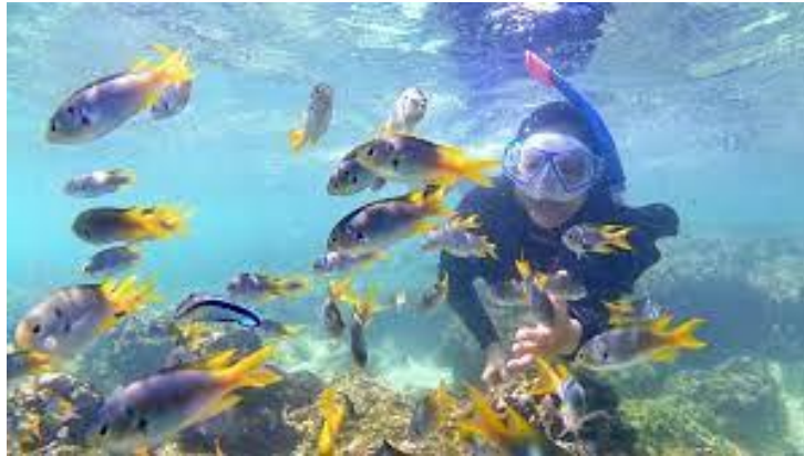
Gambar 2.5 Snorkeling Pantai Sadranan

Pantai Sadranan terletak di . Pantai ini sangat populer untuk para wisatawan menikmati keindahan alam bawah laut. Bermain Snorkeling di pantai sadranan menjadi daya tarik utama di pantai ini. Snorkeling di Pantai Sadranan dikelola oleh Pokdarwis.