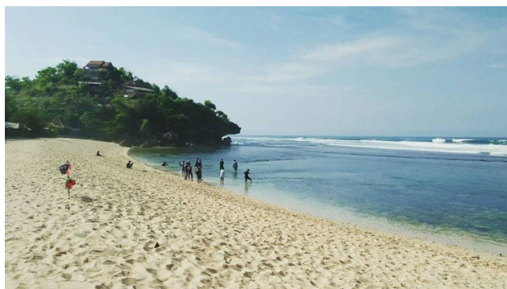
Gambar 2.4 Pasir Putih Pantai Sundak