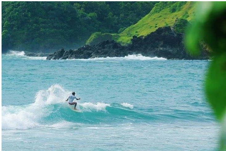
Gambar 2.3 Surfing Pantai Wediombo

Pantai Wediombo terletak di Desa Jeputo Kecamatan Girisulo. Pantai Wediombo ini memiliki daya tarik pada karang yang mengelilingi pantai. Selain itu, daya tarik pada pantai wediombo yaitu ombak yang dapat dimanfaatkan untuk bermain dan belajar surfing. Para wisatawan dapat belajar surfing di Pantai Wediombo bersama komunitas Wediombo Surfing Lesson.