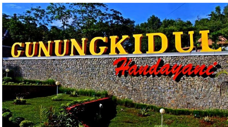
Gambar 2.1 Ikon Gunungkidul