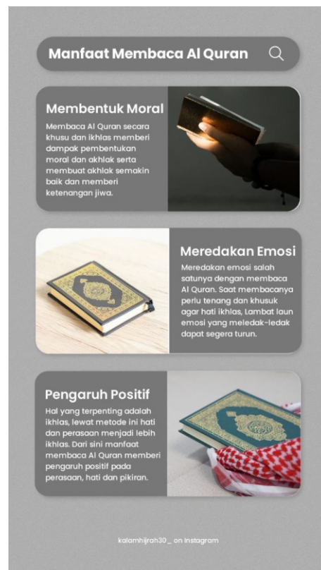
Contoh Desain Story Instagram